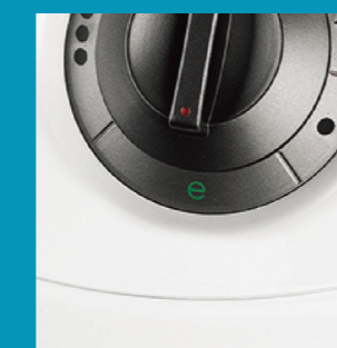
Energiesparmodus Power save mode